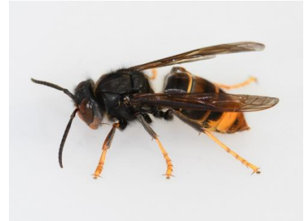
Arbeiterin der Asiatischen Hornisse

Die Asiatische Hornisse ( Vespa velutina nigrithorax ) ist etwas kleiner als unsere heimische Hornisse ( Vespa crabro ). Die Arbeiterinnen der Asiatischen Hornisse sind 1,7 bis 2,4 cm groß, Königinnen können auch bis 3 cm groß werden. Zu erkennen ist die Asiatische Hornisse an ihrer schwarzen Grundfärbung: Die Brust ist schwarz, der Hinterleib dunkel mit wenigen gelben Binden. Die Beine sind schwarz-gelb gefärbt. Sie baut zwei Nester. Das im Frühjahr von der Königin gebaute, etwa Handballen große Gründungsnest (Primärnest) hängt meist in Schuppen oder Sträuchern, teils aber auch in Bodennähe. Die Filialnester (Sekundärnester) werden im Sommer gebaut und befinden sich meist in mehr als zehn Metern Höhe freihängend in Bäumen. Das Einflugloch befindet sich seitlich am Nest. Die Nester können bis zu einem Meter Höhe erreichen.