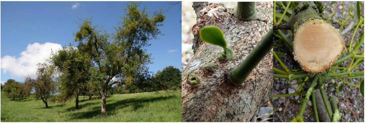
Starker Mistelbefall in einer Streuobstwiese, eine keimende Mistel und die Saugorgane (Haustoren) im Querschnitt