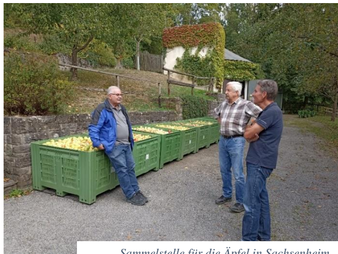
Sammelstelle für die Äpfel in Sachsenheim

Der Landkreis- Cidre wird auf der Hauptversammlung des KOGL nochmals vorgestellt. Dort kann er auch vor Ort probiert haben. Überzeugen Sie sich selbst von dem prickelndem Getränk mit seiner besonderen Apfelnote. Der Landkreis Cidre kann direkt über die Firma Schütz nach telefonischer Absprache bezogen werden.